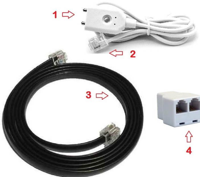
Abb. 4.1: Lieferumfang FlowTimer+ Detect Set V2